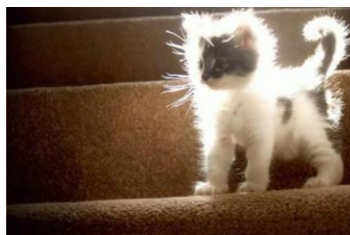
電気を遮断したことにより総毛立つ猫（4月2日付C紙インターネット版）

今回の地方総選挙において、開票作業中に 40 都市以上で停電が発生したことについて、ユルドゥズエネルギー大臣は、「猫が分電装置に侵入したことが原因だった。これは冗談ではない。」と発言。一方、国民の一部は同発言を受け、「なぜ、猫が同時多発的に開票作業時間を狙いすまして分電装置に侵入できるのだろうか。特殊な訓練を受けた特殊部隊猫かも知れない。気をつけろ！」「ゲジ公園のときは外国が陰謀を企てたそうだが、今回は猫か！」等、揶揄する書込をインターネット上で繰り返している。（4月2日付C紙4面、HD紙3面）